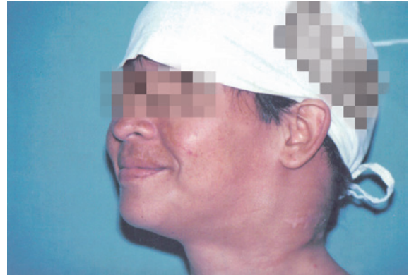
Figura 1. Nodulação em região submandibular e retroauricular.

As tumorações localizadas na região da cabeça e pescoço compreendem grande espectro de patologias, tornando difícil o raciocínio clínico diante do grande número de possibilidades