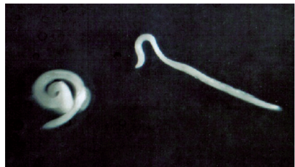
Figura 3. Verme eliminado.