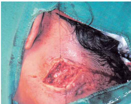
Figura 4. Higienização cirúrgica.

A lagoquilascariase humana é uma zoonose causada pelo L. minor , que cursa com massa cervical e deve ser listada como